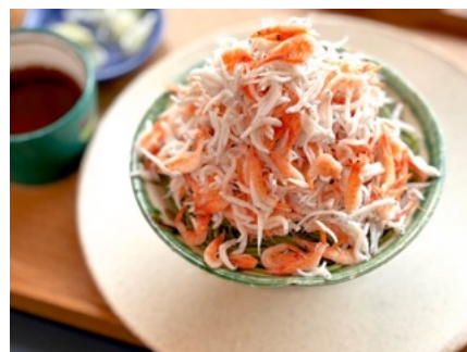
「しらす桜エビの紅白どっさり蕎麦」 2,000 円(税込)