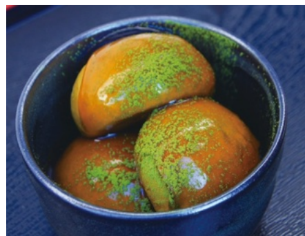
「お濃茶みたらしあんパン」550円(税込)