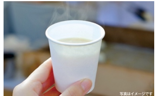
「カネジュウ」の甘酒ふるまい