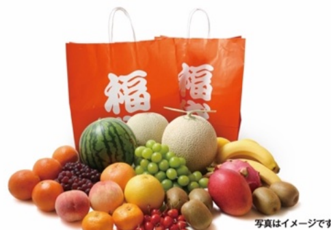
「旬の果物が詰まった福袋」2,026 円(税込)