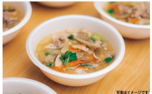
そらっ豚汁のふるまい