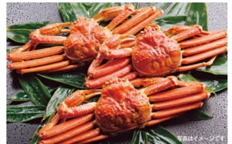
「ズワイガニ(姿)」2,026 円(税込)