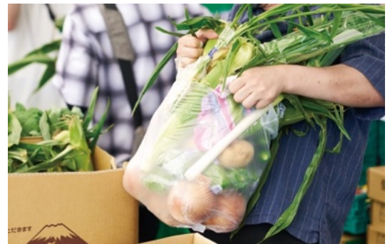
「大大大野菜詰め放題市」1,000 円(税込)