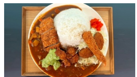
「2026!そらっとカレー」2,800 円(税込)

（アレルギー）小麦・卵・乳成分・えび・豚肉・鶏肉・牛肉・大豆・さば・りんご・ゼラチン