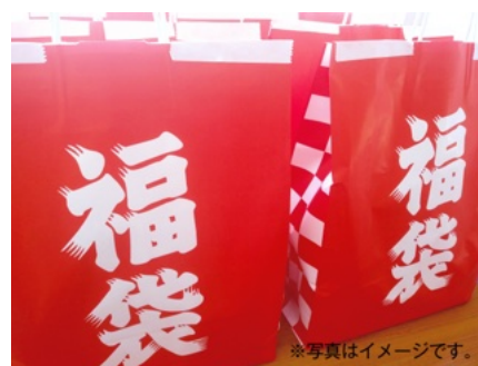
「そらっと福袋」2,026 円(税込)