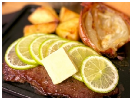
「波乗りレモンステーキ」 3,850 円(税込)