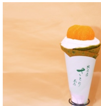
「初日の出クレープ」 1,200 円(税込)