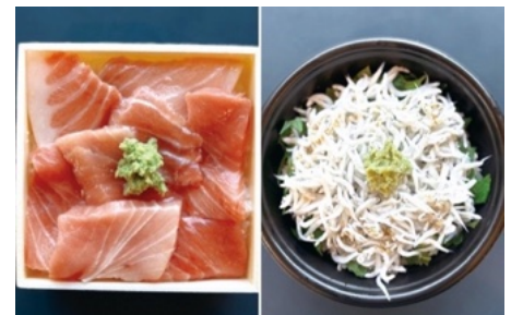
（左）「本まぐろの切り落とし丼」1,000 円(税込)