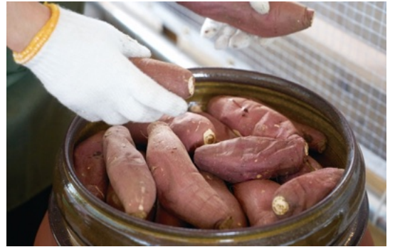
紅白さつまいもの食べ比べ